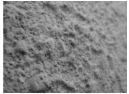
ざらざらとして塗料を吸い込みやすい外壁